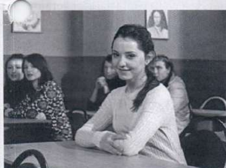
Валентина Рубцова, актриса ситкома «Универ»

Если бы звезды ТНТ праздновали Новый год вместе, то получилась бы именно такая картина, но у каждого из них был свой особенный праздник.