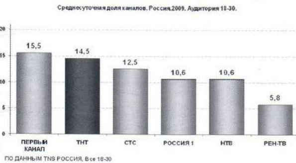
Доля ТНТ в 2009-м году. Россия, возраст 18-30 лет.

ТНТ догоняет Первый по популярности у российской аудитории в возрасте от 18 до 30 лет. Согласно данным TNS Россия, ТНТ занял второе место в 2009-м году с долей 14,5, отстав всего на 1 пункт от Первого канала (доля 15,5). На третьем месте по России – СТС, с долей 12,5.