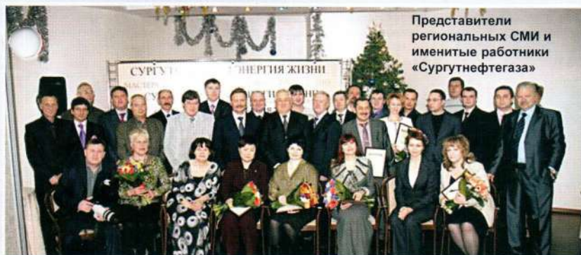
Представители региональных СМИ и именитые работники «Сургутнефтегаза»