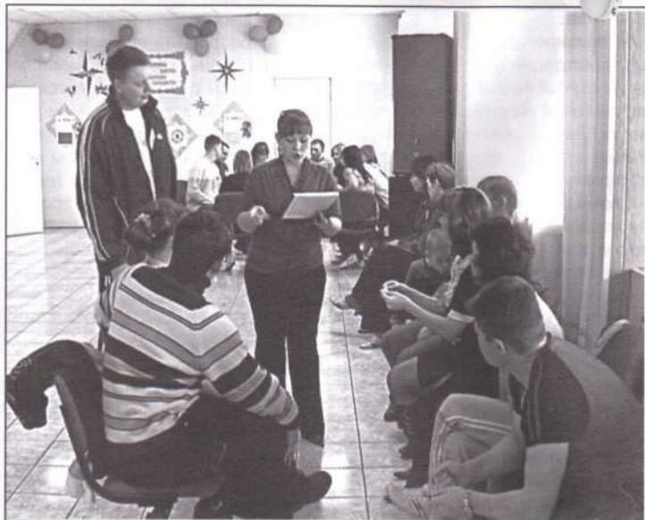
Клуб «Молодых семей»

Насчет кинотеатра... Вообще, я надеюсь, что он будет. Должен быть, даже стулья для него сделаны. Но тут уже совсем другая проблема. Привоз фильмов по районной видеосети не будет удовлетворять потребности горожан. Фильмы будут те, которые люди уже на DVD дома посмотрели. Почему? Потому что киновинки мы не оплатим. Почему? Потому, что дорогие билеты раскупаться не будут.