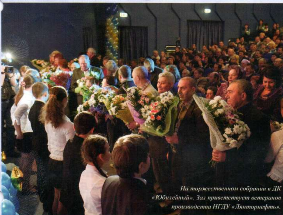
На торжественном собрании в ДК «Юбилейный». Зал приветствует ветеранов производства НГДУ «Лянторнефть».

Нефтегазодобывающее управление «Лянторнефть» ведет разработку и освоение 10 нефтяных месторождений на западном направлении промышленной нефтедобычи открытого акционерного общества «Сургутнефтегаз».