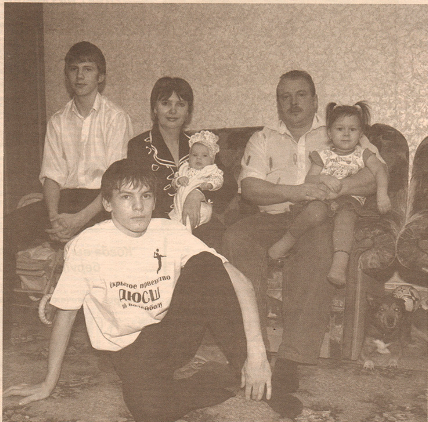
Семья Кожемякиных