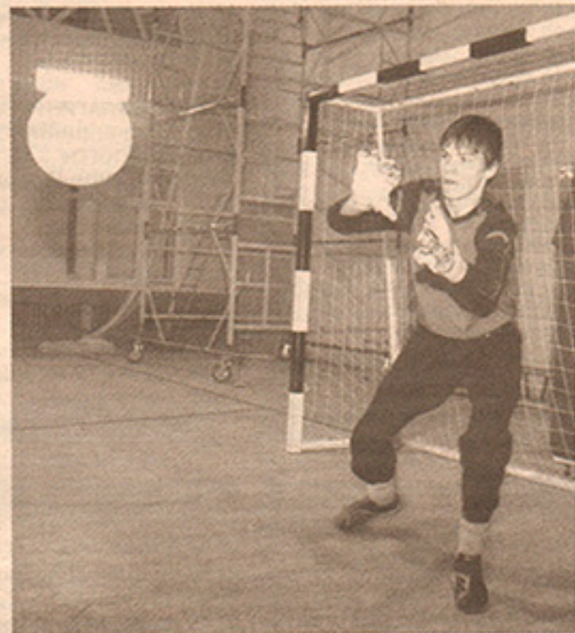
Ни одного мяча в ворота!

- У вас есть секрет, как воспитать детей само-