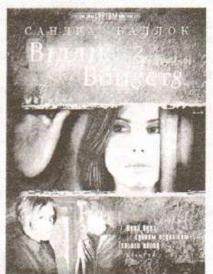
«В деревне» («The Village») (США, 2004 г.)

05.50 «Саша + Маша» Воскресенье, 20 февраля 06.00, 06.30 М/с «Жизнь и приключения робота-подростка» 07.00, 07.25 М/с «Как говорит Джинджер» 07.55 М/с «Бейблэйд: Горячий металл» 08.20, 09.00, 09.25 Т/с «Друзья» 08.55 «Лото Спорт» Супер Лотерея 09.50 «Первая Национальная» и «Фабрика удачи» 10.00 «Школа ремонта». «Дом-2» «Тяжелая стена» 11.00 «Экстрасенсы ведут расследование» 12.00 Д/ф «За что готовы драться парни» 13.00 Х/ф «Золото дураков» 15.05, 15.40, 16.10 Т/с «Интерны» 16.40 Х/ф «Остров» 19.30 Прогноз погоды (ГТРК «ЛянторИнформ») 20.00 Х/ф «Рок-н-рольщик» 22.20 Комеди Клуб 23.00, 04.25 «Дом-2. Город любви» 00.00 «Дом-2» 00.30 Comedy Woman 01.30 Х/ф «Отсчет убийств»