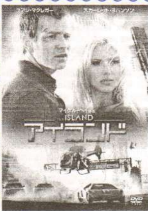
«Остров» («The Island») (США, 2005 г.)

Фантастика/боевик. Линкольн Шесть-Эхо – это не секретный код. Это имя типичного жителя второй половины XXI века. Он обитает в изолированном городе будущего. Всю жизнь ему твердят: лучших жителей отправят на «Остров» – последнее благополучное место на планете. Однако вскоре Линкольн узнает: все, во что он верил долгие годы – ложь! Режиссер: Майкл Бэй В ролях: Юэн МакГрегор, Скарлетт Йоханссон, Джимон Хунсу, Шон Бин, Стив Бушеми