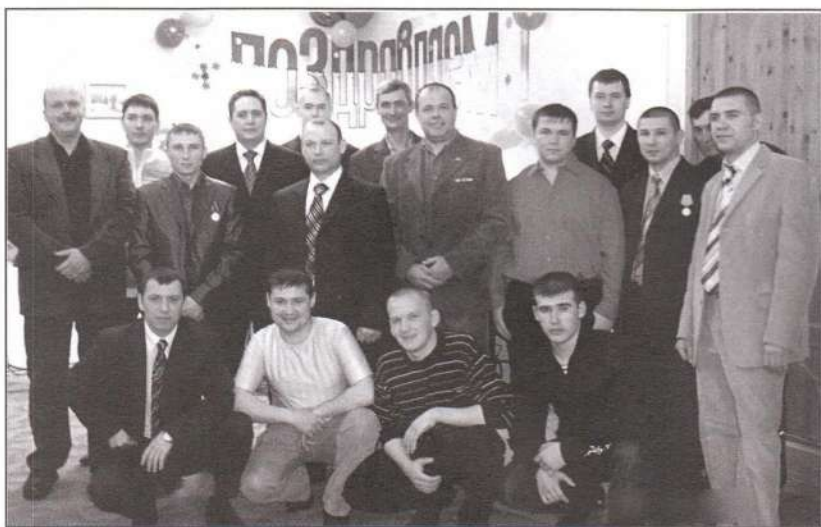
▲ Участники сургутской районной общественной организации ветеранов боевых действий

- От государства поддержка есть, программа существует. Это всевозможные льготы. Но хочется больший акцент сделать на физической и моральной подготовке молодежи. Ни одно государство не сможет существовать, если у него не будет своих патриотов и защитников. На этом все государства держатся.