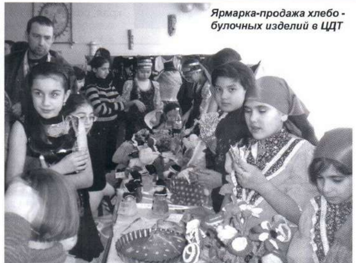
Ярмарка-продажа хлебо-булочных изделий в ЦДТ

Ребята, одетые в русские народные костюмы, предлагали всем плоды своего тру-