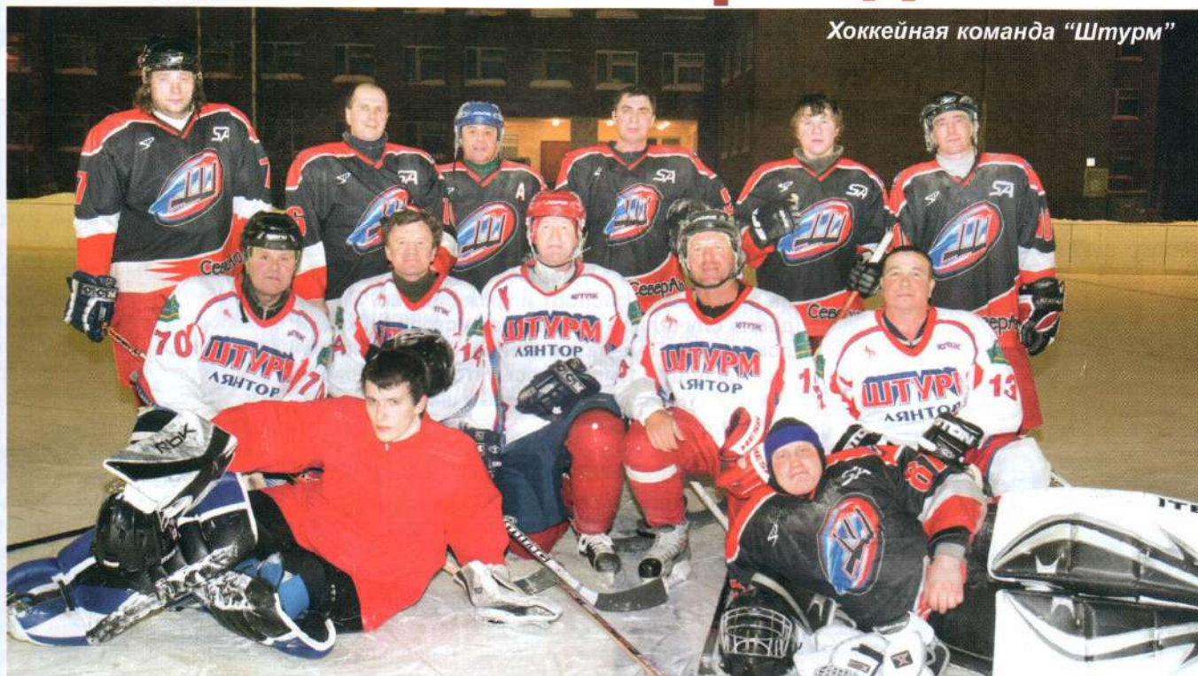
Хоккейная команда “Штурм”

Приехав 18 лет назад в Лянтор из южного города Волжский, я была уверена, что вот здесь-то я вдоволь накаюсь на коньках: кругом снег, лед. Для южной девочки, где зима редко балует морозцем хотя бы в 10 градусов, Север казался неким подобием «каткового рая». Каково же было мое изумление, когда ближайший каток я обнаружила в г. Сургуте. Так мои белые ботиночки с железными полозьями провисели без дела на гвоздике....поз-