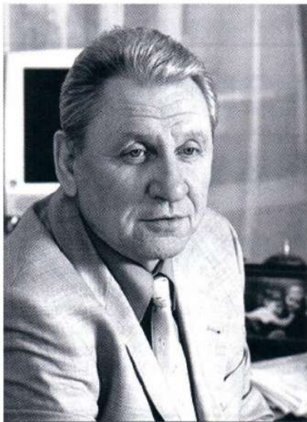
А.В. Филипенко, губернатор ХМАО-Югры

Грядет смена исполнительной власти в округе. Данный Президентом России губернатор Югры Наталья Комарова, высказавшая в СМИ, что будет продолжать курс развития региона, не знакома югорчанам. Оттого и с недоверием относится население стабильно благополучного округа к изменениям во власти. Хочется оставить все как есть. Боязнь неизвестного нового человека, судить о котором можно только по представлениям властимущих, да комментариям пиарщиков.