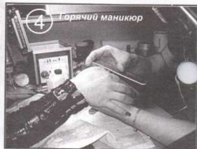
4 Горячий маникюр