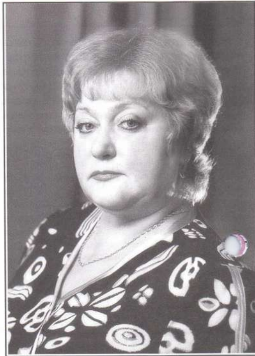
△ Людмила Корзюкова, председатель Думы города Лянтора

- Надо использовать все имеющиеся сегодня информационные каналы: и телевидение, и газету, и Интернет. Ведь пенсионеру вряд ли доступен Интернет, но он смотрит телевизор и привык читать газету. Информацию можно разме-