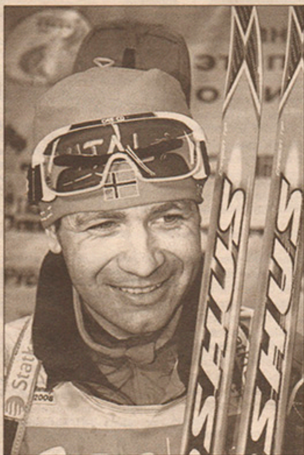
Уле-Айнар Бьорндален. Норвегия