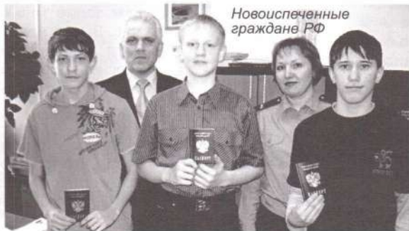
Новоиспеченные граждане РФ