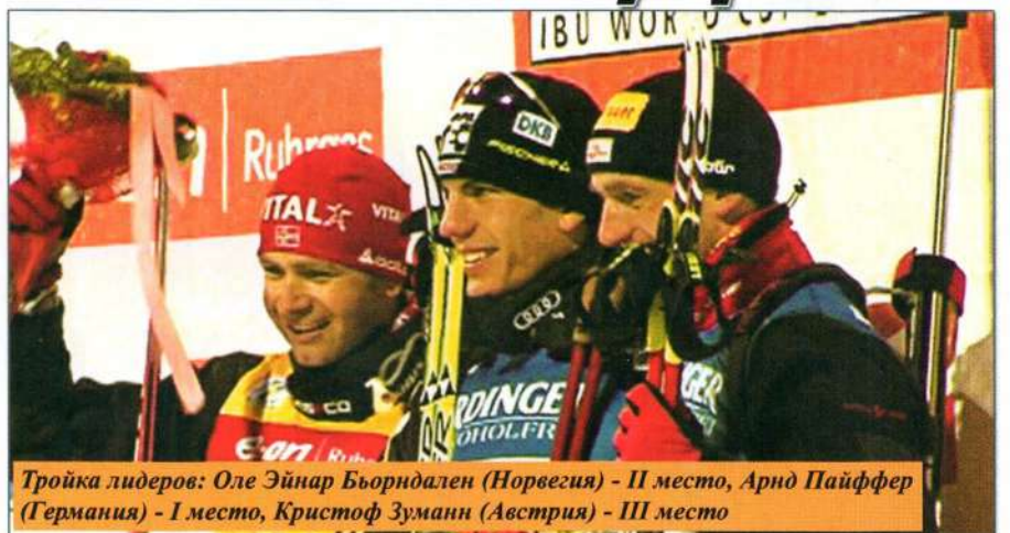
Тройка лидеров: Оле Эйнар Бьорндален (Норвегия) - II место, Арнд Пайффер (Германия) - I место, Кристоф Зумани (Австрия) - III место

На зависть болельщикам призеры финального спринтерского забега на девятом Кубке Мира по биатлону в Ханты-Мансийске Арнд Пайффер, Оле Эйнар Бьорндален и Кристоф Зуманн отпраздновали победу не «отходя от кассы». Победители разделили «на троих» три литра безалкогольного пива, подаренного одной немецкой компанией. Правда, выпить его пришлось из одного бокала.