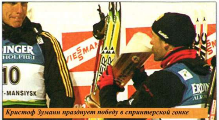
Кристоф Зумани празднует победу в спринтерской гонке