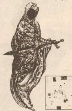
Рисунки Владимира ЗОЛОТУХИНА