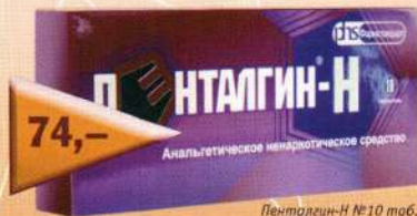
Пенталгин-Н №10 таб.