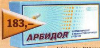
Арбидол 0,1 г №10 капс.