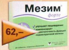
Мезим форте №20 таб.п/о