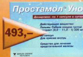
Простамол Уно 320мг №30 капс.

«Аптека Оптовых цен» - это реально низкие цены и это объективный факт. Так что зачем экономить на здоровье, если экономить можно на лекарствах?