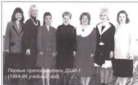
Первые преподаватели ДШИ-1 (1994-95 учебный год)

жет сказать каждый из дружной творческой семьи Первой школы искусств. Все мероприятия здесь готовятся сообща, педагоги могут посоветоваться друг с другом, подсказать движение. Например, когда номер уже готов, а чего-то не хватает, подключаются все, равнодушных не остается. Несмотря на то что все творческие люди имеют массу амбиций, в этом коллективе только здоровая конкуренция: и достижениям радуются все вместе, и трудности разделяют сообща.