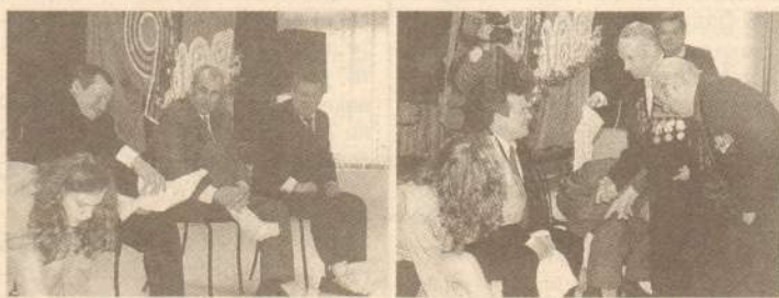
Наглядный урок-проверка по наматыванию пряток