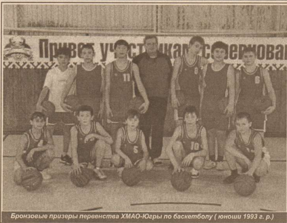
Бронзовые призеры первенства ХМАО-Югры по баскетболу (юноши 1993 г. р.)