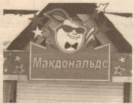
мечта беспокойного горожанина

3. В городе нет детского кафе. А детишкам очень хочется побывать в «Макдональдсе», реклама которого идет по всем каналам телевидения. Я думаю, что в выходные, праздничные дни, дни каникул посещаемость была бы очень высокая. Ведь детей в городе немало. Существовавшее раньше кафе «МАЛЫШ» неудобно располагалось, что и было проблемой. 4. Центр города действительно как – то пуст без кафе. В центре каждого города бывает масса подобных заведений, где и приезжие могли бы перекусить, и гости города, любясь местными достопримечательностями.