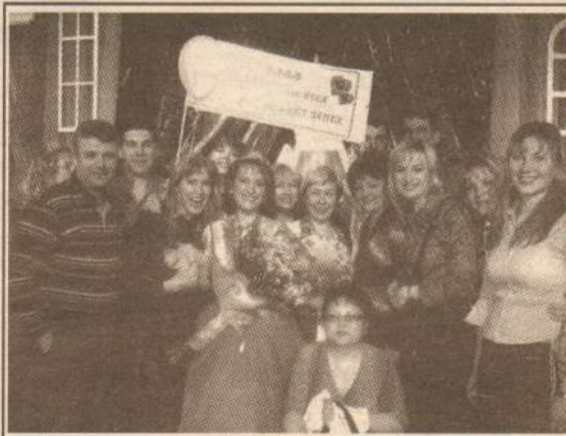
Нефтяная королева и её группа поддержки