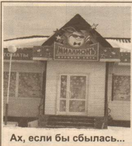
Ах, если бы сбылась...

1. В центре города негде прилично покушать. Допустим, отстояла я очередь в ЖЭУ или администрации, а после этого мне в другое место необходимо справки отнести, или в поликлинике 2 часа просидела, а следующий прием через час. Домой пообедать я никак не успеваю: у автобуса как раз перерыв, пешком идти далеко, личного автомобиля у меня нет, на такси не хочется тратиться, на рынке кушать я не хочу. Я думаю, многие горожане находились в подобной ситуации, не я одна. Если бы в центре было приличное и недорогое кафе, было бы неплохо. И ориентировано оно должно быть на быстрое питание, а не на вечеринки и банкеты (такие заведения есть, но там дорогая кухня).