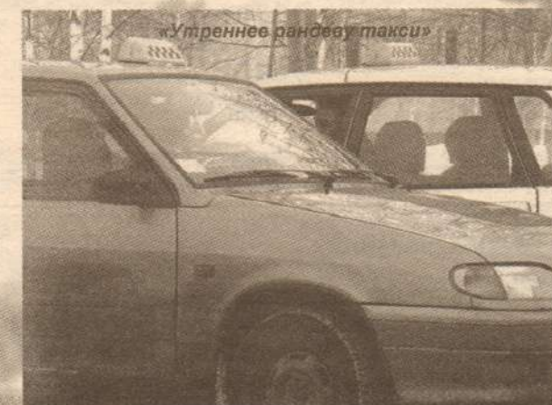
«Утренняя рансееву такси»

Представители УТВиВ провели отключение водоснабжения в квартирах должников за комму-