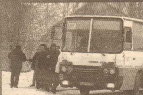
Рабочий день на промзоне начинается с городской остановки.