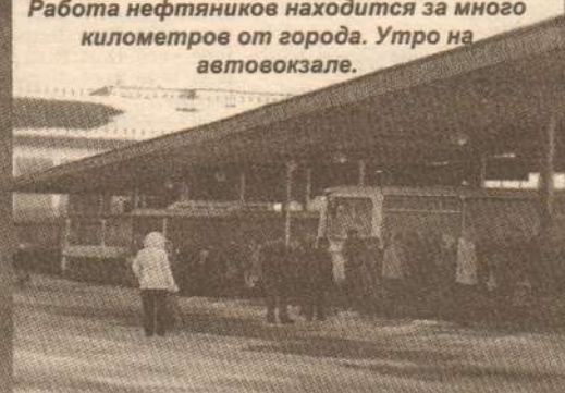
Работа нефтяников находится за много километров от города. Утро на автовокзале.