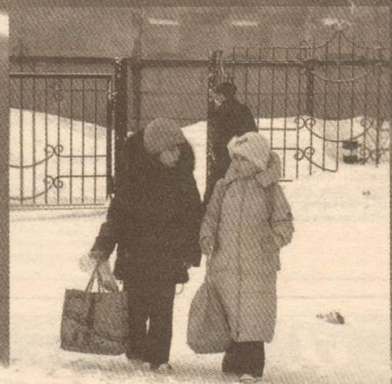
«А я вчера «пятерку» за контрольную получила!»