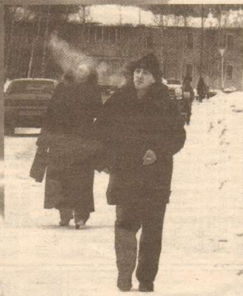
«Что день грядущий мне готовит?»