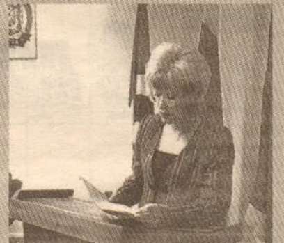
Дата проведения: 24 марта 2007 года Место проведения: администрация г. Лянтор

Второй раз Устав городского поселения Лянтор выносятся на открытое обсуждение