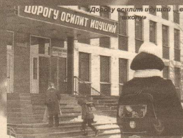
«Дорогу осилит идущий ... в шкорм»