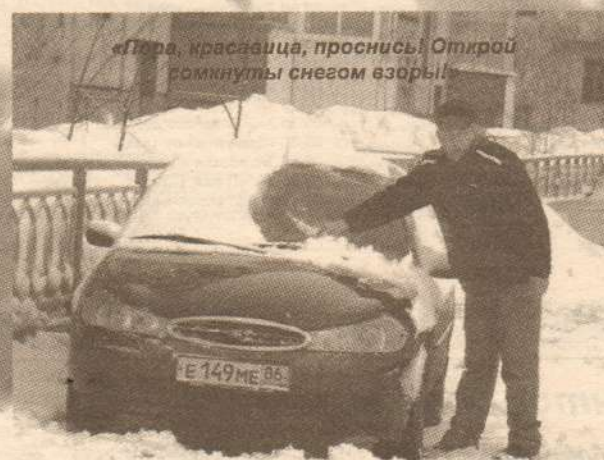
«Пора, красавица, проснись! Открой сомкнуты снегом взоры!»