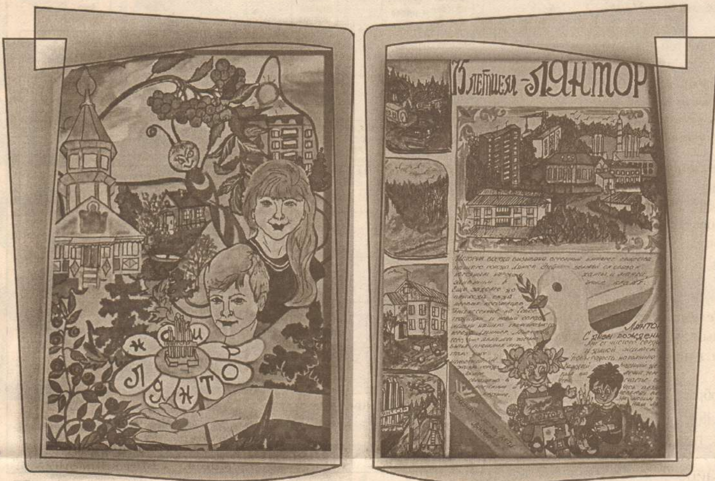
Рисунок Евгения Чудайкина

Сочинения юных лянторцев - участников конкурса, посвященного 75-летию Лянтора