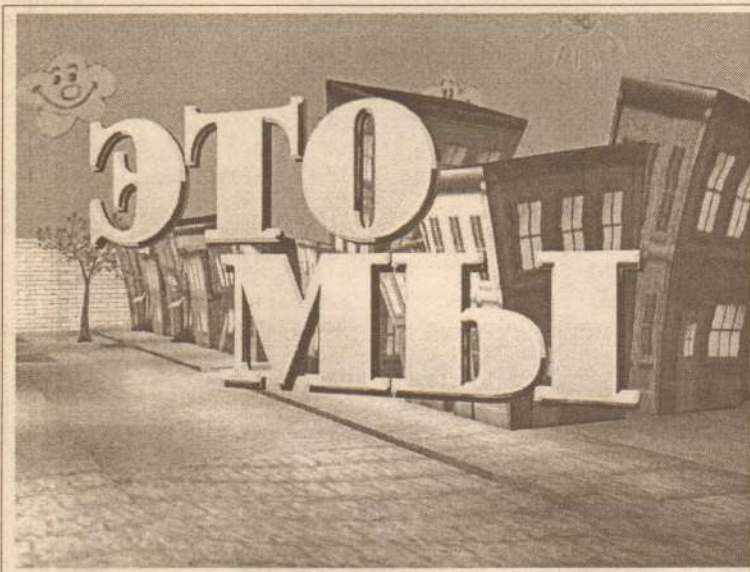
Возвращение детской программы «Это-мы!»

Все лучшее – детям! Этот лозунг в наше время перестал быть приоритетным, несмотря на реализацию в стране приоритетных нацпроектов «Здоровье» или «Образование». Совершенно отрицать пользу этих государственных мероприятий и для детей, в том числе, не берусь. Однако детское здоровье поправляют преимущественно вакцинацией, а в образовании и вообще больше внимания материальной поддержке лучших педагогов (кстати, вовсе не благоприятствующей здоровому микроклимату в педагогическом коллективе). Здоровое тело и умная голова – это еще не залог здорового поколения. А кто же позаботится о воспитании духовности, патриотизма, нравственности наших детей? Пятый нацпроект? Школа? Семья? Общество? Улица? Компьютер? Телевизор? Книжки?