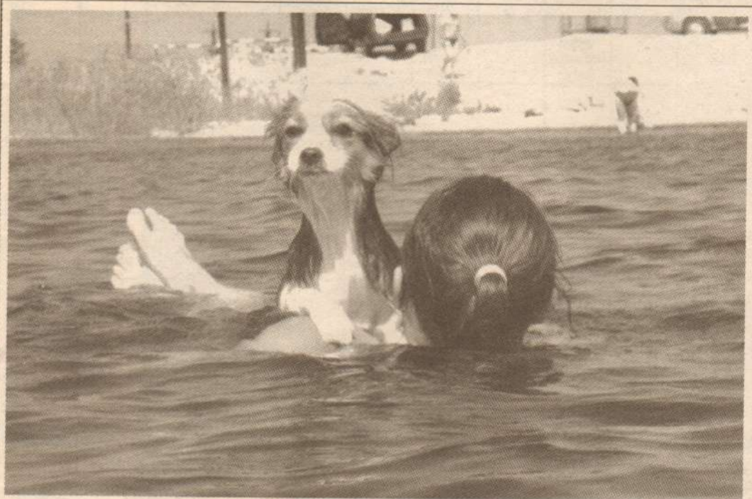
«Крепко, надежно судно, и вдаль глядит отважный капитан»