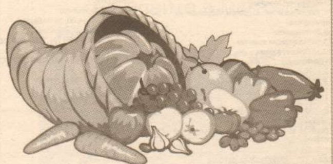
Рубрику подготовила Полина Изметова