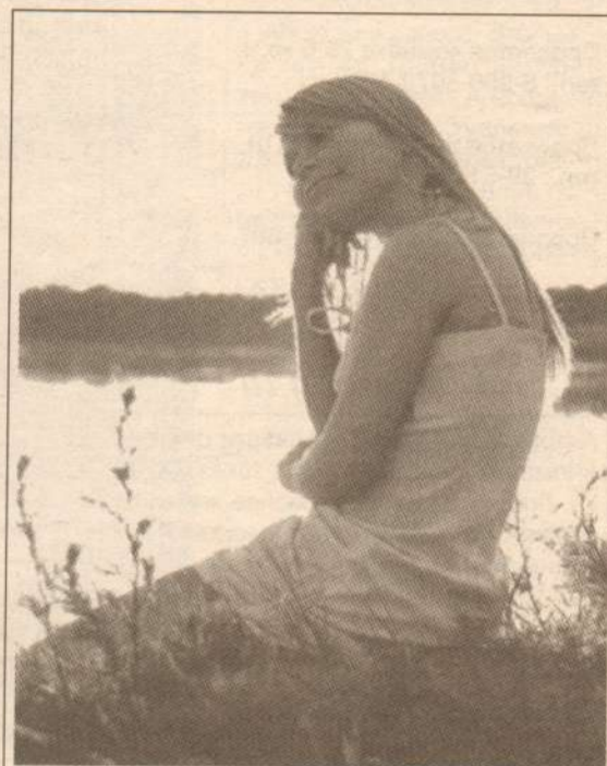
«Где же мой братец Иванушка?»

До встречи на страницах «Лянторской газеты»!