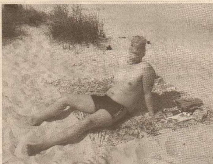
На песочке я сижу, но на солнце не гляжу.

Наш конкурс завершен. Представляем вам последние работы участников фотоконкурса «Лето в Лянторе». Победитель станет известен в следующем номере.