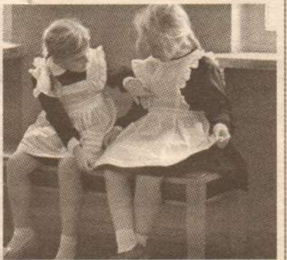
Рубрику подготовила Ирина Камартинова

(ТМ/НВ) или мягкий (2М - 4М/2В - 4В). Очень мягкие карандаши будут пачкаться.