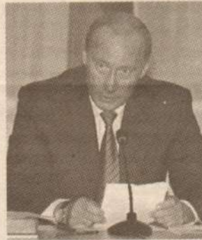
Служба новостей «URA.RU»

Путин даст старт новым выборам в Госдуму 2 сентября, об этом «URA.Ru» сообщил источник в Центральной избирательной комиссии России. Именно в грядущее воскресенье президент РФ подпишет указ о начале избирательной кампании. После чего ожидается, что в понедельник-вторник (3-4 сентября) он будет опубликован в печати, и новая избирательная кампания будет считаться официально начавшейся. «По закону на опубликование указа дается до 5 дней», - пояснили в Центризбирком. Сами выборы, как известно, назначены на 2 декабря 2007 года.