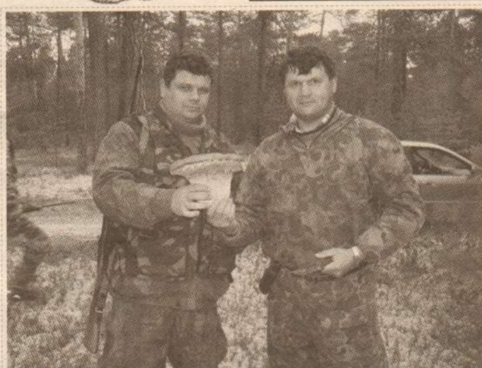
Теперь понятно, чем питаются такие крепкие парни!