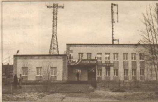
Здание лянторского отделения связи

Ответ на этот вопрос мы ДОСТАЛИ у начальника Сургутского районного отделения услуг связи Владислава Никифорова.