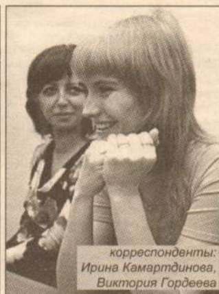
корреспонденты: Ирина Камартинова, Виктория Гордеева