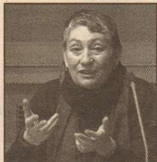
Писательница Людмила Улицкая

На презентации проекта «Другой, другие, о других» известная писательница Людмила Улицкая познакомила гостей со своей новой серией книг, посвященных толерантному воспитанию школьников.