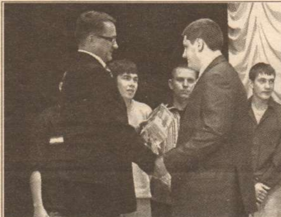
День призывника в Лянторе

Именно термос стал в этом году памятным подарком для призывников от главы города.