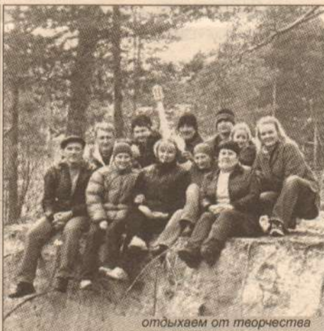
отдыхаем от творчества