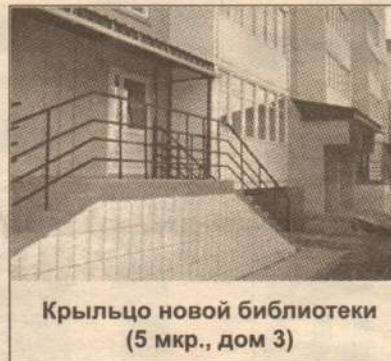
Крыльцо новой библиотеки (5 мкр., дом 3)

Сейчас юных читателей обслуживает городская библиотека № 2 (4 мкр., дом 4) и центральная городская библиотека. Как заявила директор МУК «Лянторская централизованная библиотечная система», официальное открытие планируется в середине декабря.