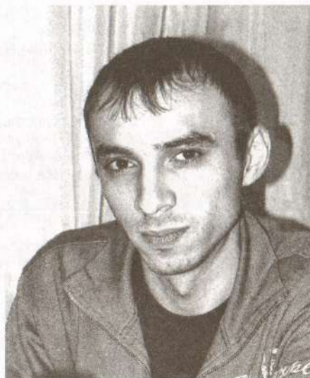
Вугар Алиев – фотограф:

Весь исходный материал попадает в руки редактора Натальи Тимофее-