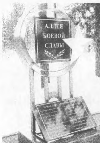
Обелиск на территории Лянторского ХЭМ хранит имена 18-ти пимчан, не вернувшихся с ВОВ.