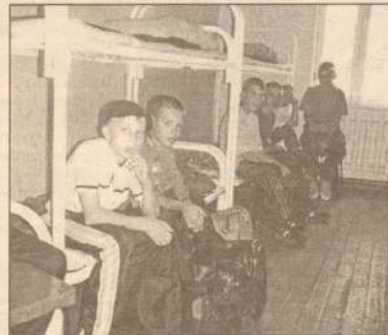
Детский взвод в казарме.