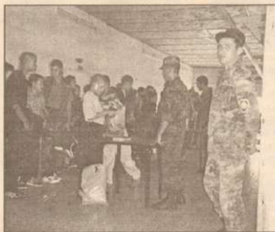
А что у вас в котомках?