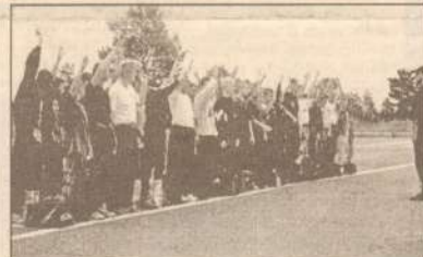
Хотим служить в армии.