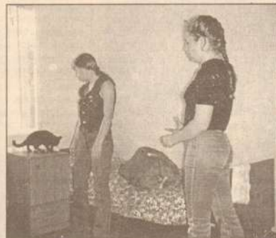
В Армии, как дома.