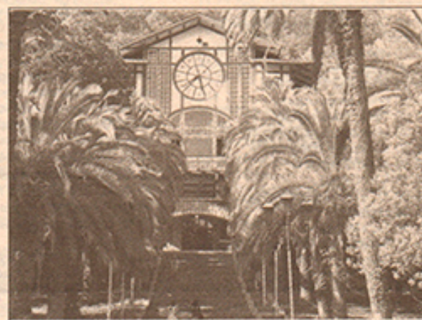
Абхазия, Гагры, ресторан «Гагрипш»

обойдутся в 18 500, в Геленджике - в 27 000. Судя по этим ценам, можно сделать вывод: поездка и проживание за границей ненамного доро-