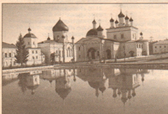
Город Калуга. Мужской монастырь «Довидова Пустынь»

дней за границу. Турция около 49 тысяч рублей. Пожить в пятизвёздочном отеле Египта, пожалуйста, за 55 тысяч рублей. Мальдивы – 46, трёхзвёздочный в Греции - за 30. А теперь наши российские цены так же на 14 дней для одного туриста. Санаторий «Алтайский замок» - 35 000. «Ай-Даниль» в Ялте – 30 500. В Анапе 14 дней в доме отдыха «Юность»