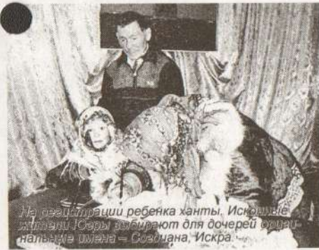
На регистрации ребенка ханты, Исключные жители Югры выбирают для дочерей имена: Наталья, Ольга - Сюзюлана, Искра.

Урожайным на ребятешек оказалось первое полугодие 2011го: в местных органах ЗАГС зарегистрировали 258 новых граждан России. Поровну мальчиков и девочек - 129 (данные на 11 июня 2011 года). Рейтинг популярных женских имен - Анастасия, Диана, Алина. Мальчиков чаще нарекают Даниилами, Матвеями и Михаилами. Двойная радость, в виде близнецов пришла в 2 семьи. А вот тройни в Лянторском ЗАГСе пока видеть не приходилось, но какие наши годы... Разродимся еще! И наверняка, ставших в одночасье многодетных родителей отметят особым образом, как не обходят вниманием ребятешек, записанных в текущем году под «круглым» номером.