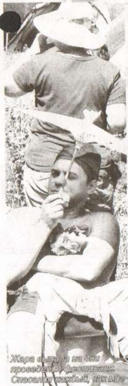
Жара сыграла на руку проведение фестиваля. Спасение находил, как всегда