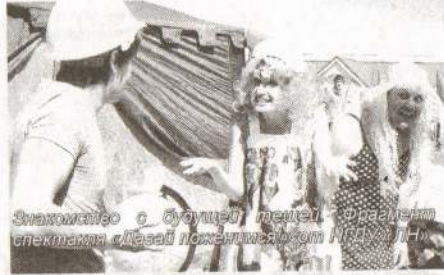
Знакомство с будущей невестой. Фрагмент спектакля «Давай поженимся!» от НГДУ «ЛН»