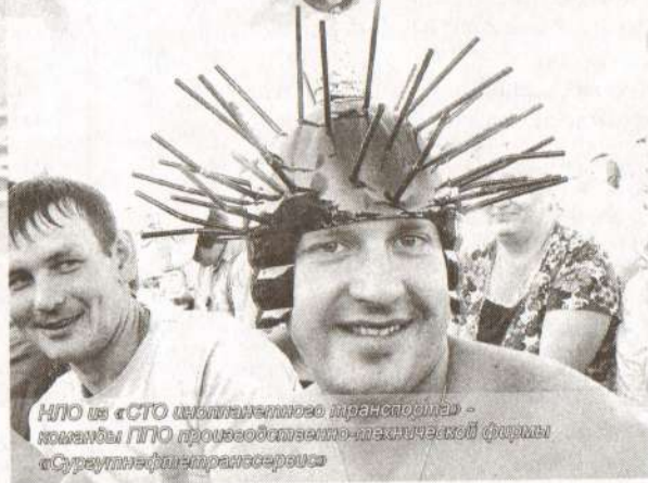
НПО из «СТО инопланетного транспорта» - команды ППО производственно-технической фирмы «Сургутнефтетранссервис»