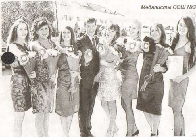
Медалисты СОШ №3