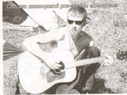
Соплист лянторской рок-группы «БердБас»