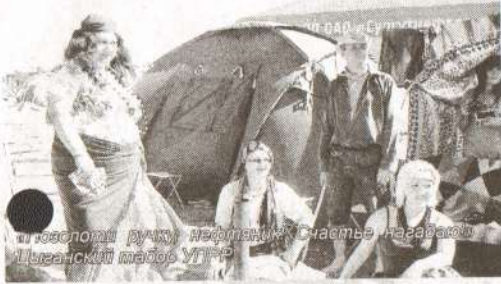
Поселок дачку нефтяники? счастье наравно! Цыганский табор УГРР

Путевки в санаторий на Черноморском побережье выиграла в качестве специального приза команда НГДУ «Лянторнефть» на фестивале бардовской песни «Высокий Мыс – 2011». На презентации палаточного городка наши земляки показали незабываемый спектакль под названием «Давай поженимся!».