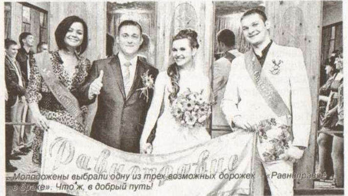
— Молодожены выбрали одну из трех возможных дорожек «Равноправия в браке». Что ж, в добрый путь!

зарегистрировать брак до рождения ребенка, по совместному заявлению обоих, можно оформить Свидетельство об установлении отцовства, на