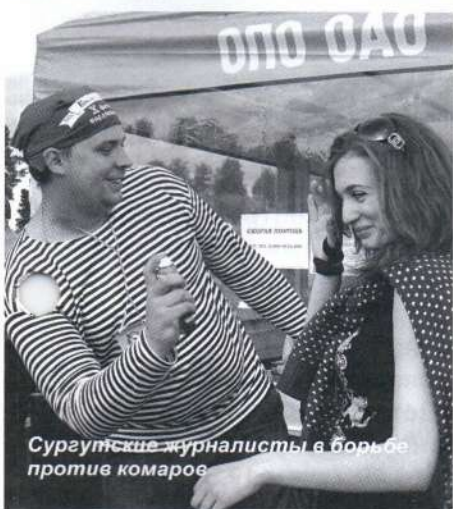
Сургутские журналисты в борьбе против комаров