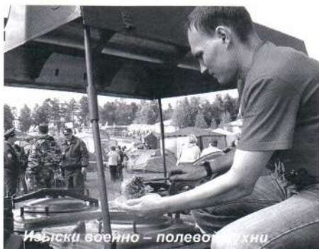
Мыски военно-полевой хиты