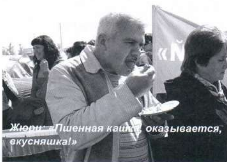
Жюри: «Пшеничная кашка оказывается, вкусняшка!»