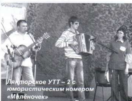
Лянторское УТТ – 2 с юмористическим номером «Милёночек»