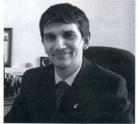
дет зафиксирован факт хищения, то это покажет съёмка.

водиться соответствующими органами на основании постановления прокурора. В случае, если охранник заподозрит вас в том, что вы не оплатили какой-либо товар, единственное, что он может сделать, это, в первую очередь, вызвать правоохранительные органы. Также до прибытия милиции он может вас задерживать, но это проблематично, ведь его действия не должны превышать необходимые меры физического воздействия на человека. В любом случае, сегодня магазины самообслуживания оборудованы видеокамерами, поэтому если бу-