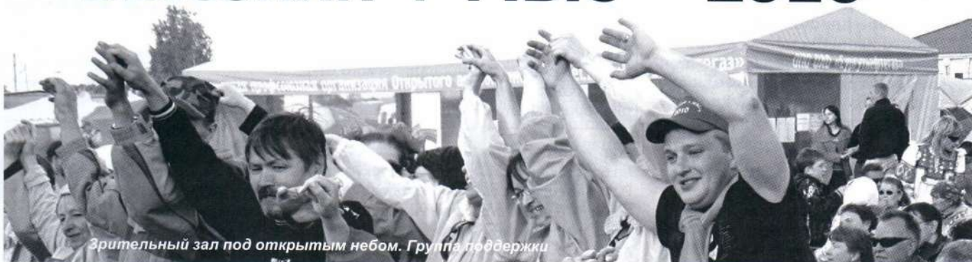
Зрительный зал под открытым небом. Группа поддержки