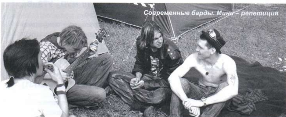
Современные барды. Миш – репетиция