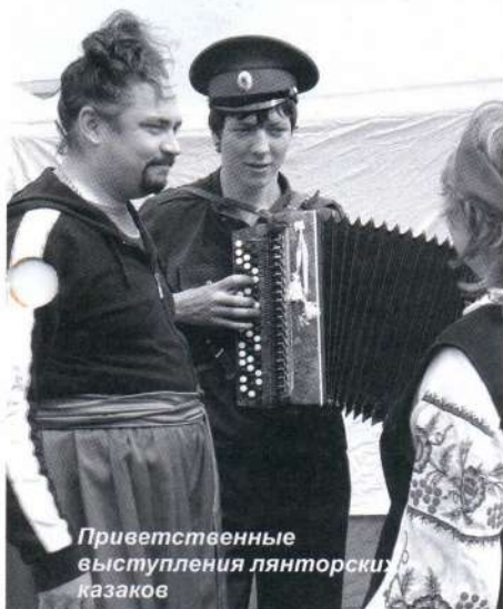
Приветственные выступления лянторских казаков