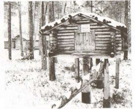
Лабаз для хранения вещей

метров друг от друга, фасад и вход смотрят на реку. Дом, по поверьям ханты, защищает не только от холода, дикого зверя, но и не впускает злых духов. Таинство начинается уже с места выбора для постройки. По окончании строительства, приносится жертва Най-Ими (огненной женщине) - в чувале сжигается кукла в красной одежде. Для Матери-земли - Мых-Анки приносится в дар чёрная ткань, на северный священный угол.