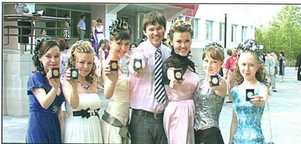
Медалисты школы № 3 г. Лянтора

2009 год запомнится в Лянторе многим не только проблемами, связанными с кризисом, но и блестящим окончанием школы лянторскими выпускниками.