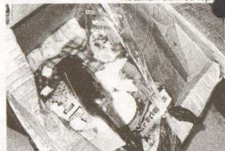
Кошкин дом вечером

Речь шла о братьях наших меньших. Тех, которые никому не нужны, и зачастую становятся объектом для издевательств. Сколько их, одиноких, преданных, измученных, бродит по земле! А сколько их в Лянторе! Как они, бедняги, заглядывают в наши глаза в поисках добра! А мы проходим мимо... Люди, а