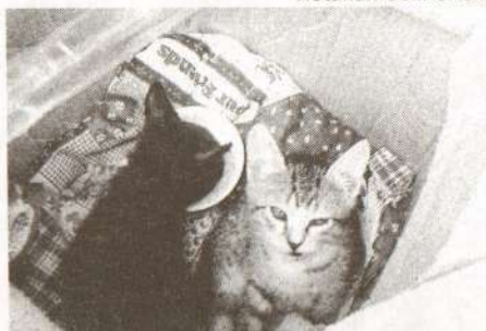
Кошкин дом днем