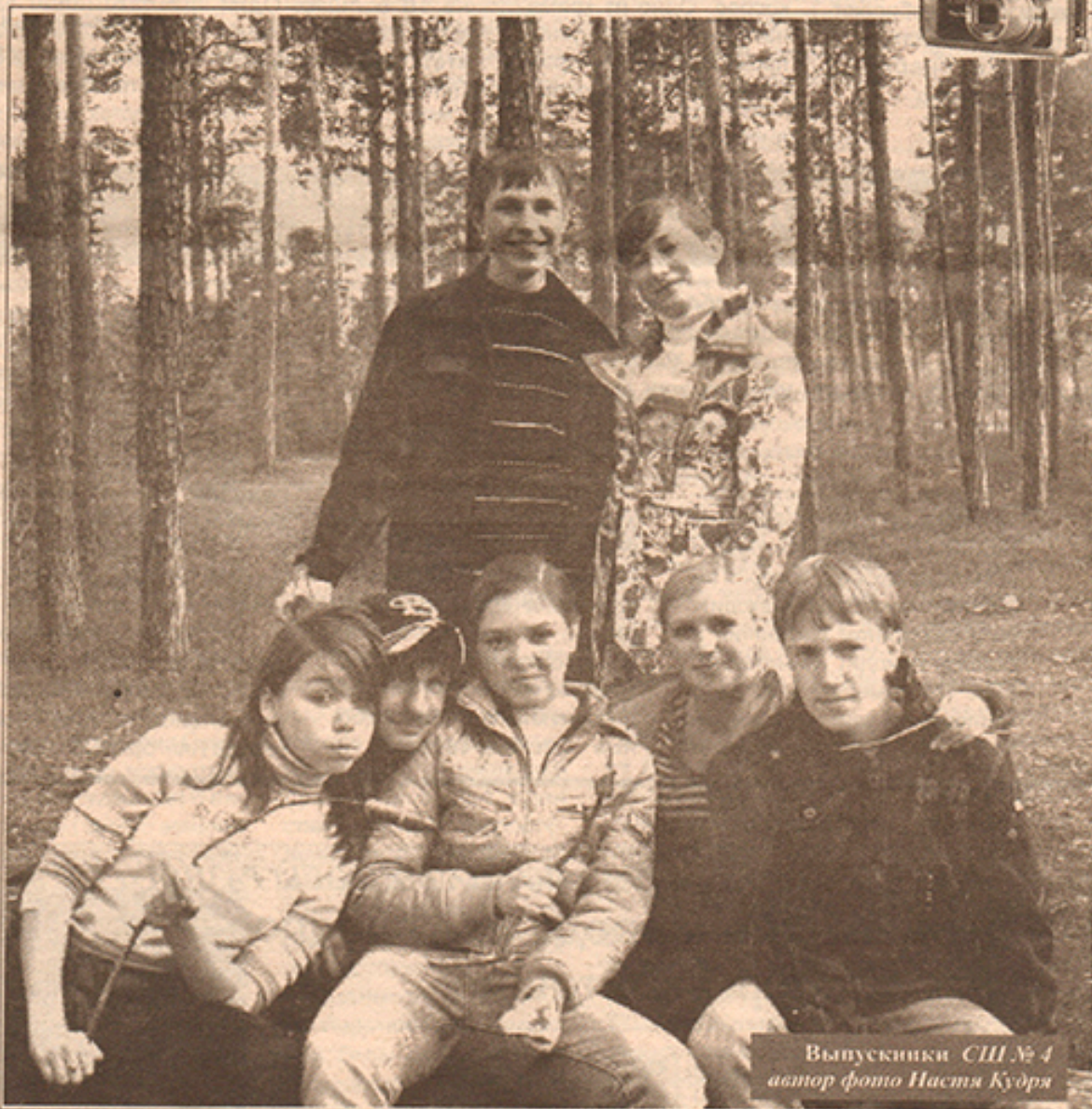
Выпускники СШ № 4

Главное условие конкурса – на снимке должны быть выпускники обязательно 2008 года (неважно, за каким занятием).