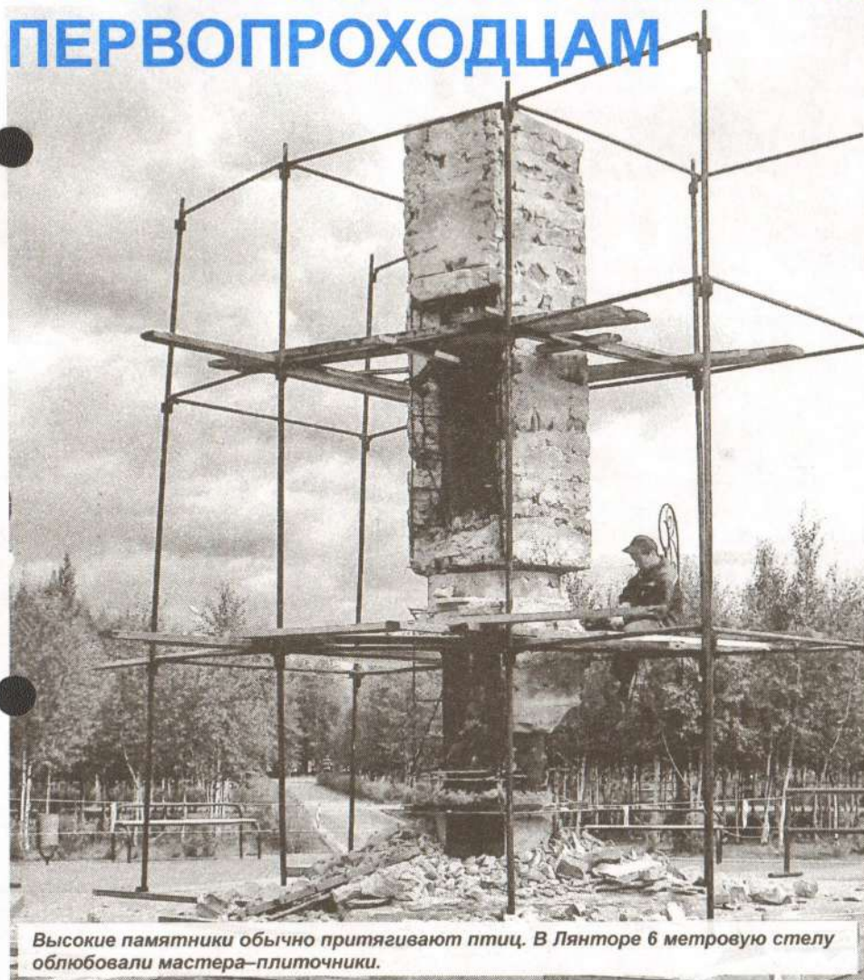
Высокие памятники обычно притягивают птиц. В Лянторе 6 метровую стелу облюбовали мастера-плиточники.

На минувшей неделе в городском сквере возобновили ремонт памятной стелы. После реставрации в Лянтор вернулся декоративный бронзовый барельеф, с уточненной датой основания нашего населенного пункта - 1931 год. Напомним, объектом внимания мастеров памятник впервые стал в конце мая. Когда вскрыли гранитную обшивку, оказалось, что под ней никуда не годный фундамент. Таким образом, изначальный фронт работ пришлось дополнить. Обновлением памятника занимается ООО «Дом-сервис», именно эта компания взялась осваивать целевые муниципальные средства, по некоторым сведениям - более одного миллиона рублей. Первоначально оговаривалось, что работа подрядчиков будет завершена к 1 августа. Сейчас очевидно, что стелу в новом облике из серого, черного и красного гранита лянторцы увидят не раньше сентября.