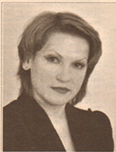
Депутат Думы ХМАО Югры Л.А.Малышкина