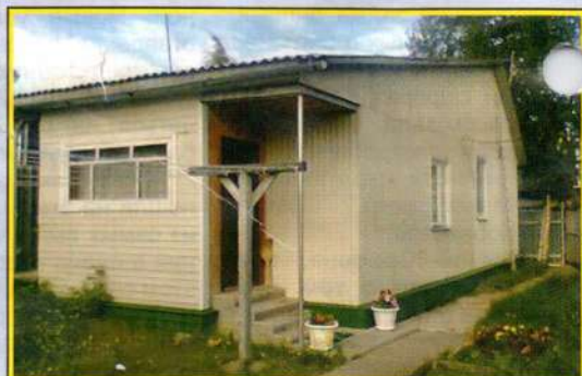
Продается дом по ул.Эстонских дорожников площадью 61 кв.м, участок в собственности (450 кв.м). Стоимость 1800 тыс.руб. Торг. Тел.: 96-173, 8-950-518-0757.