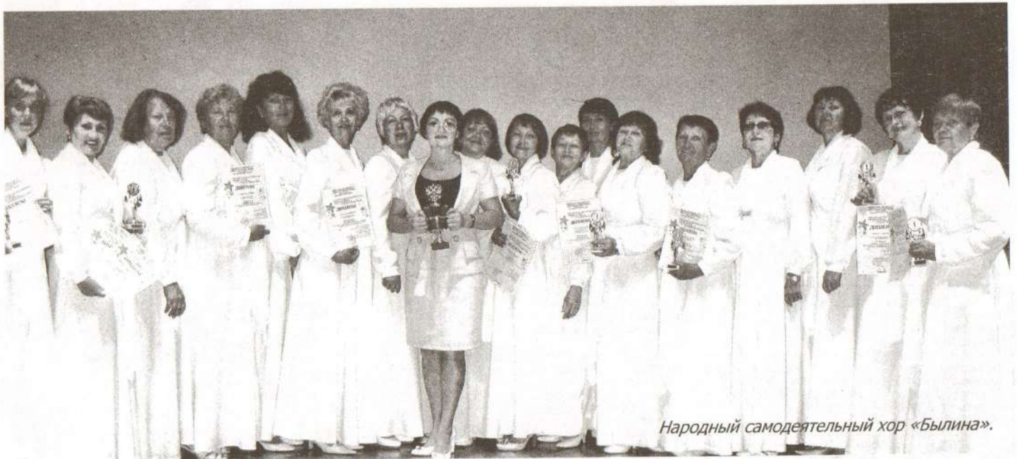
Народный самодеятельный хор «Былина».

АНАСТАСИЯ ВОЛКОВА Информация и фото предоставлены Ниней Халиловой