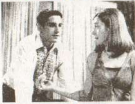
«Американский пирог» «American Pie»

Анонс Четверо друзей-пузеров заключают договор – к выпускному вечеру каждый из них должен уже, наконец, лишиться девственности, чего бы им это ни стоило. Но не все так просто – не каждая девушка готова пустить этих парней на порог своего дома – не то что в спальню!