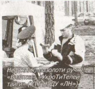
Нефтяник, позолоти ручку! «Визитка» «Укроти Телей тайги» (УПГ НГДУ «ЛН»)