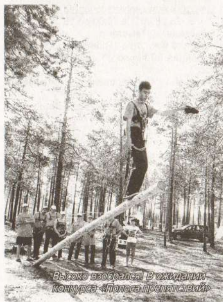
Высоко взобрался! В ожидании конкурса «Полоса препятствий»