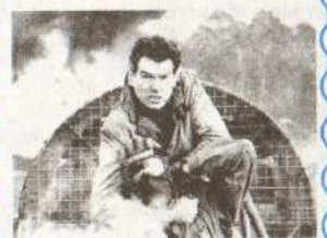
«Агент 007. Умри, но не сейчас»