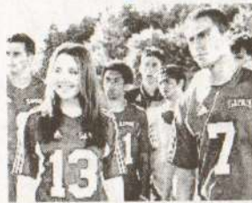
«Она - мужчина»