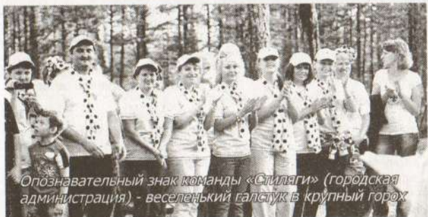
Опознавательный знак команды «Стиляги» (городская администрация) - веселенький галстук в крупный горох