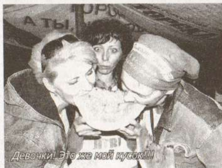
Девочки! Это же мой кусок!!!