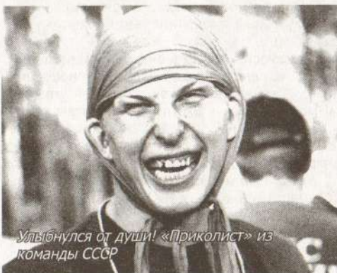
Улыбнулся от души! «Приколист» из команды СССР