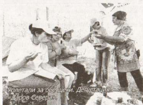
Уплетали за обе щеки. Дегустация «Даров Севера».