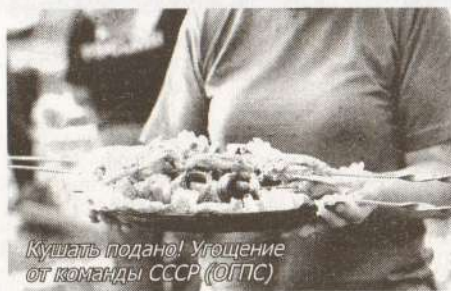
Кушать подано! Угощение от команды СССР (ОГПС)