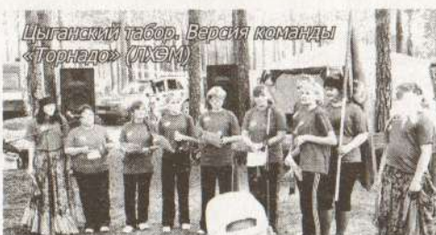
Цыганский табор. Версия команды «Торнадо» (УХСМ)