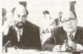
«Что могло быть хуже?»