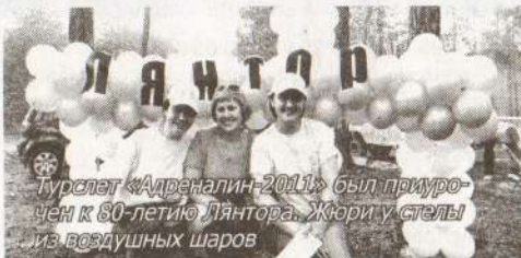
Турслет «Адреналин-2011» был приурочен к 60-летию Лянтора. Жюри у стелы из воздушных шаров