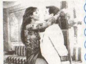
«Агент 007. И целого мира мало»