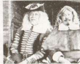
«Возвращение мушкетеров, или Сокровища кардинала Мазарини»