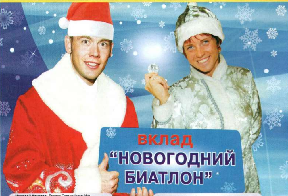
Николай Круглов. Призер Олимпийских Игр, 4-кратный чемпион мира по биатлону