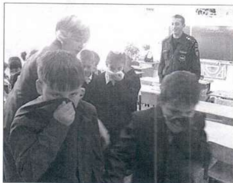
▲ Эвакуация с учащимися, 3 класса СШ № 5

«Раз в полугодие мы проводим занятия с лялторскими школьниками. Объясняем ребятам, насколько значимы знания пожарной безопасности. Мы хотим с детства научить детей правилам поведения при пожаре, чтобы эти знания пошли с ними по жизни, и в самый ответственный момент