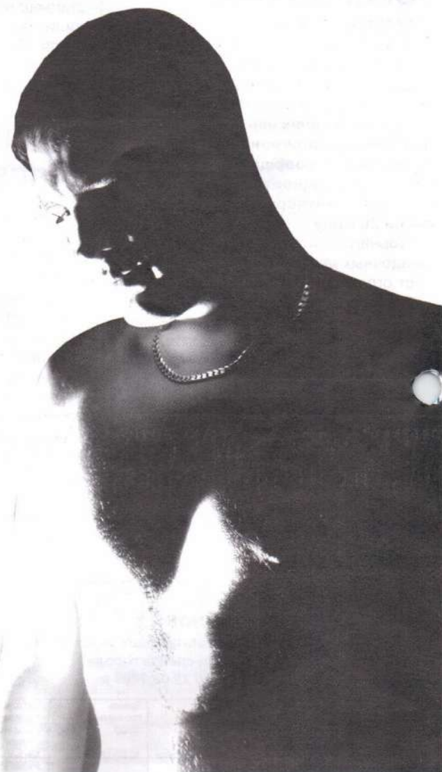
Всю жизнь каждый день человек встает перед выбором: Свет или Тьма

мировым финансовым кризисом специалисты бьют тревогу: к традиционным неврастеникам и несчастно влюбленным добавились оставшиеся без средств к существованию работяги и разорившиеся бизнесмены. Доказана на сегодняшний день и биологическая почва склонности к суицидальности – нарушения в серотониновой системе головного мозга, закреплённые генетически. Как следствие – повышенная подверженность стрес-