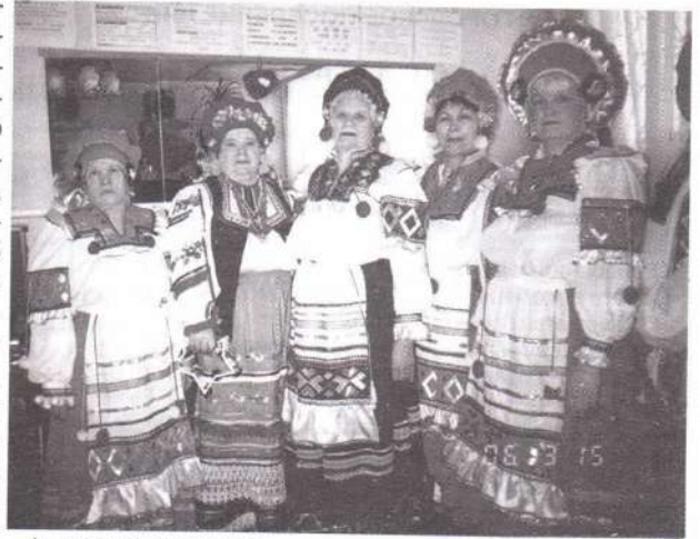
▲ Хор «Рябинушка»

А мне важно и то, что мне есть для кого жить, о ком заботиться, кому радоваться.»