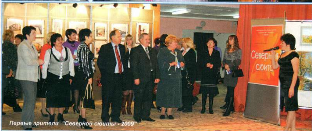
Первые зрители "Северной сюиты - 2009"