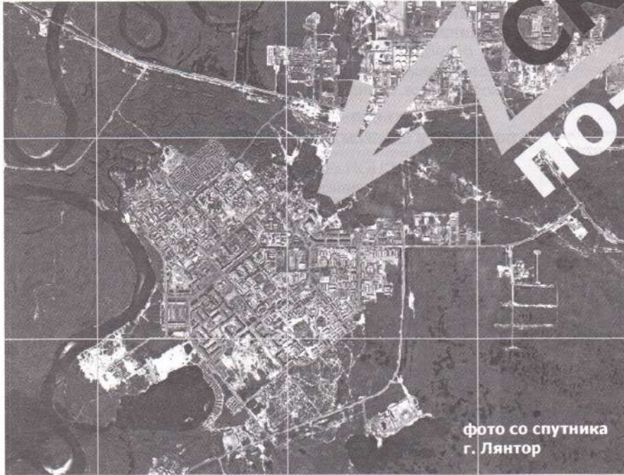
фото со спутника г. Лянтор

Кризис проявился и на рекламных щитах, где все чаще можно увидеть не рекламу магазина или банка, а картинку социальной тематики, вроде «Подарил жизнь – подари будущее», призванную пробудить сознательность должников-