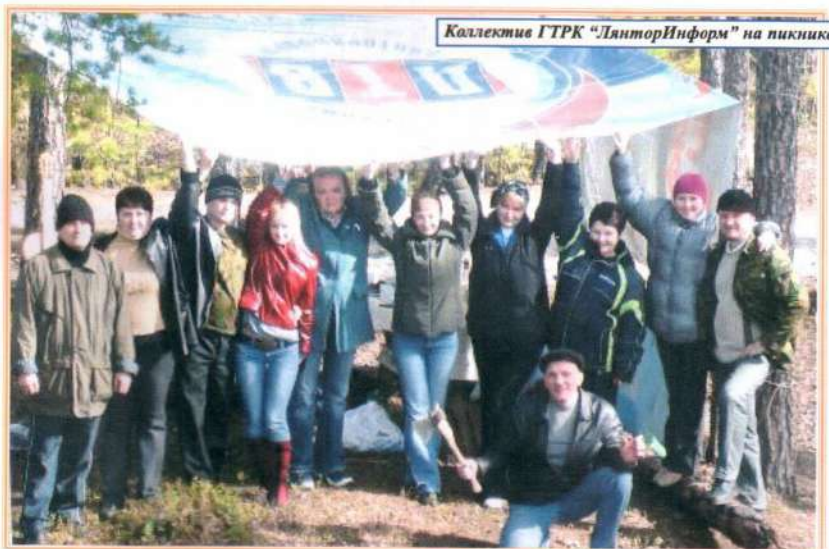
Коллектив ГТРК «ЛянторИнформ» на пикнике

Мы с радостью опубликуем фото вашего дружного коллектива на страницах нашего издания.