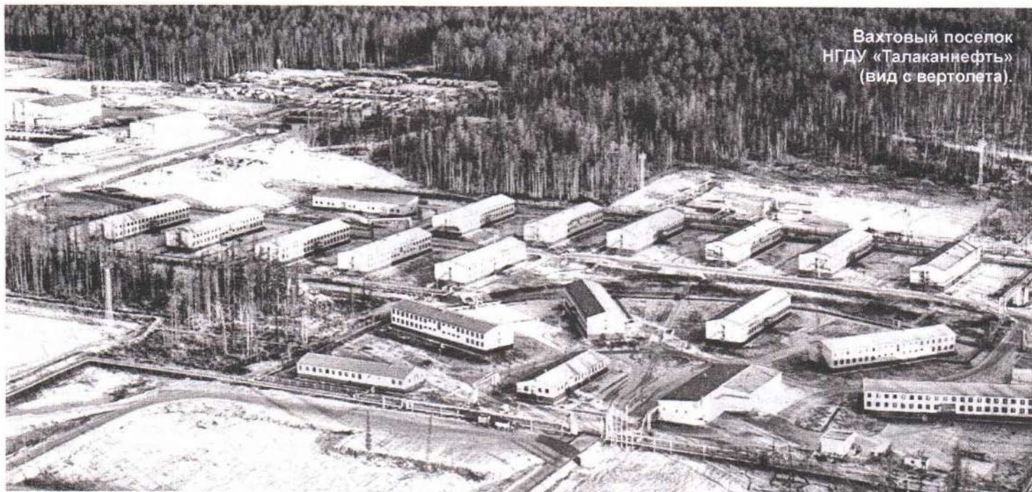
Вахтовый поселок НГДУ «Талаканнефть» (вид с вертолета).