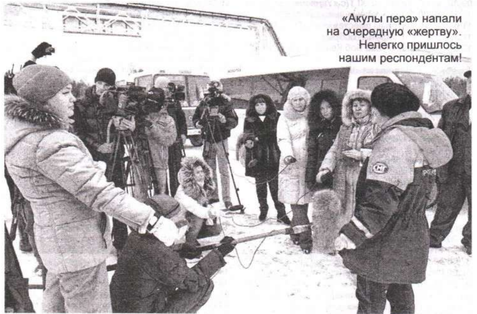
«Акулы пера» напали на очередную «жертву». Нелегко пришлось нашим респондентам!

Захватывающий пейзаж открывается перед нами за пару километров до Витима. С высоты сопки видно ветвление реки Лены, на ее берегу новый грузовой порт, чуть в стороне – Витим, ставший первым пристанищем для командированных в Восточную Сибирь сургутских нефтяников. История села началась в 1621 году. Само месторасположение населенного пункта определило род занятий его жителей - охота на пушного зверя, лесозаготовка. XIX век открыл сюда дорогу золотоискателям, именно тогда Витим обрел славу «Разбой-села». С этой натуры, уверяют старожилы, Вячеслав Шишков писал свое произведение «Угрюм-река». Сегодня и без того богатая история населенного пункта пополнилась еще одной значимой страницей – нефтяной. В 2003 году ОАО «Сургутнефтегаз» получил лицензию на разработку Талаканского месторождения, и закипела жизнь в провинциальном поселке. Для недропользователей дороги - это объекты первой надобности, а потому в рекордные сроки проложили сначала «бетонку». От Витима до Талаканского месторождения - 112 километров. Сегодня часть маршрута, к радости во-