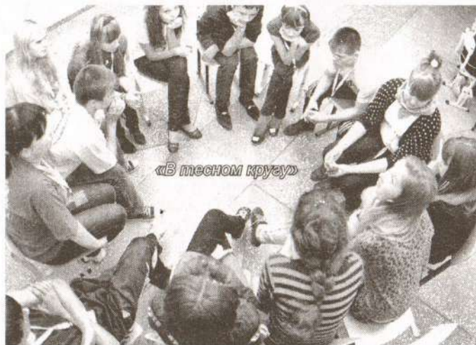
«В тесном кругу»