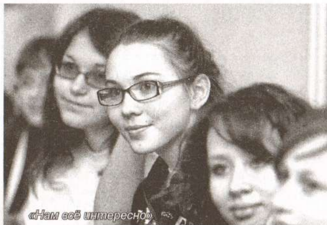
«Нам всё интересно»