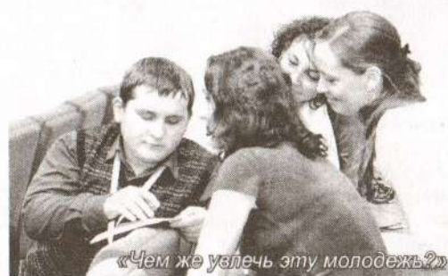
«Чем же увлечь эту молодежь?»