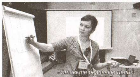
«Ставьте реальные цели»

К девизу молодежного слета общественных объединений Сургутского района присоединилось более 150 человек, представителей девяти поселений Сургутского района. Насыщенная двухдневная программа слета включила в себя мастер-классы по социальному проектированию, тренинги личностного роста и выявления лидерских качеств, круглые столы и встречу «без галстуков» с представителями исполнительной власти, депутатами города, района, области. Тренинги и мастер-классы проводили специально приглашенные модераторы из Ханты-Мансийска, Тюмени, Москвы.