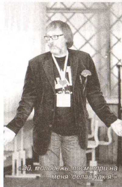
«Эй, молодежь, посмотри на меня: делай как я!»