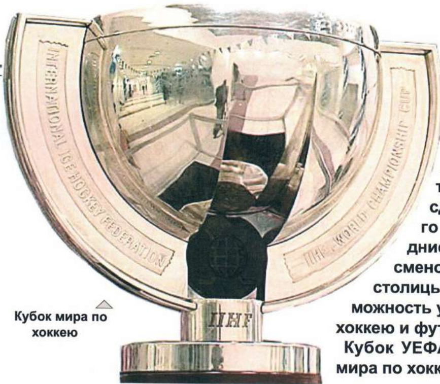
Кубок мира по хоккею

Лянтор стал площадкой для проведения пятого районного фестиваля «Мы – россияне!». 4 ноября в ДК «Юбилейный» свое творчество показали представители различных национальных обществ из большинства территорий Сургутского района.