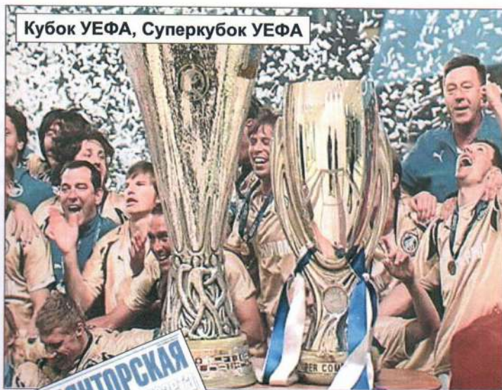
Кубок УЕФА, Суперкубок УЕФА