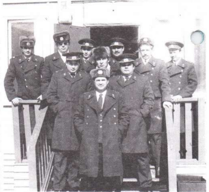
Личный состав Пимского поселкового отделения милиции

торского Отдела внутренних дел, в которых тогда работало 168 сотрудников, 92 из них — с офицерским званием. С его приходом на должность начальника значительно поменялся личный состав ЛГО.