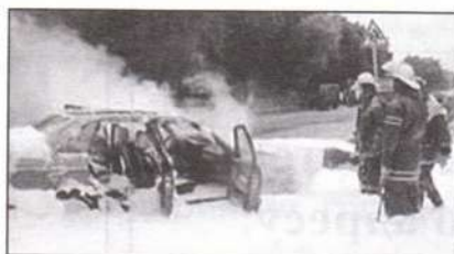
Заместитель начальника ПЧ-66 ОГПС-21 Толубаев Эльмурза