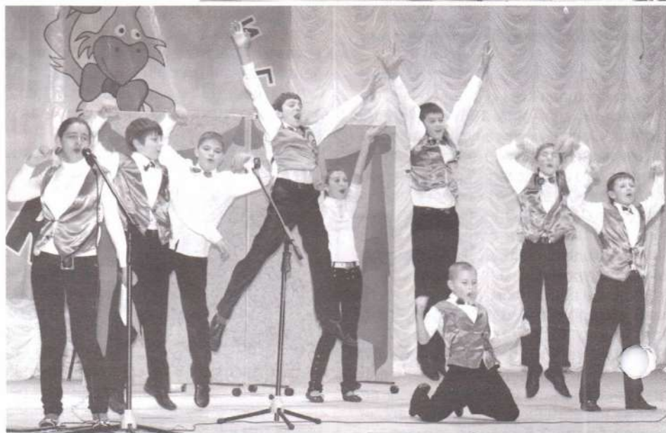
КВН – окрыляет! Уверены представители «Киндер ШИП».

«Никого не пущу!» – говорит вахтер студенческого общежития. Хотя в Лянторе нет студенческих общаг, КВНщики пофантазировали и на эту тему. Выступление молодежной команды «Шпана».