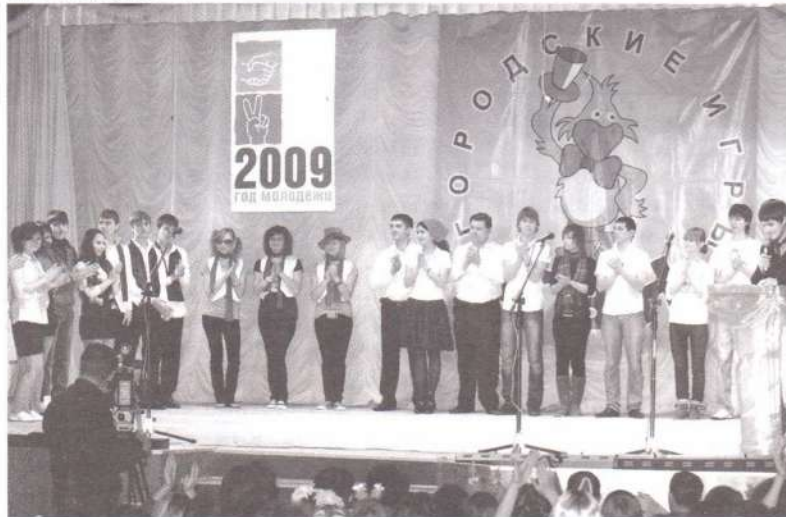
Все веселые и находчивые в сборе! Итак...мы начинаем КВН!

Эту игру в Лянторе любят давно и уже с полной ответственностью можно заявлять, что она стала популярной среди лянторской молодежи. В этот раз организаторы разделили мероприятие на два блока. В одном выступали три молодежные команды: «Добровольцы», «Вопиющие в кустах-2» и «Шпана». Во второй части волю своей находчивости дали школьники города.