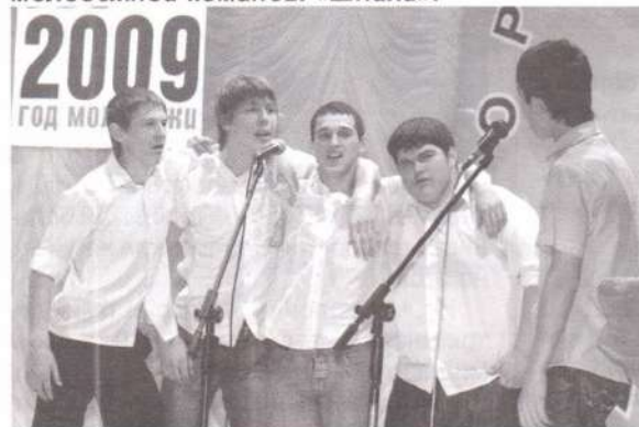
У мужчин тоже есть свои проблемы. «Вопиющие в кустах-2» представили свою версию клуба бывших мужей.

«Никого не пущу!» – говорит вахтер студенческого общежития. Хотя в Лянторе нет студенческих общаг, КВНщики пофантазировали и на эту тему. Выступление молодежной команды «Шпана».