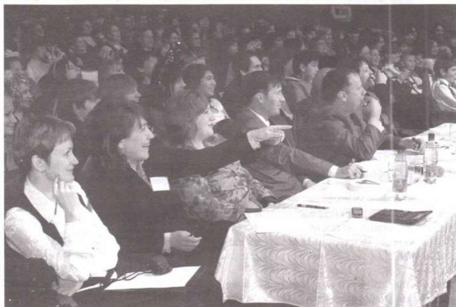
«Смотри, что вытворяют! Вот умора!»