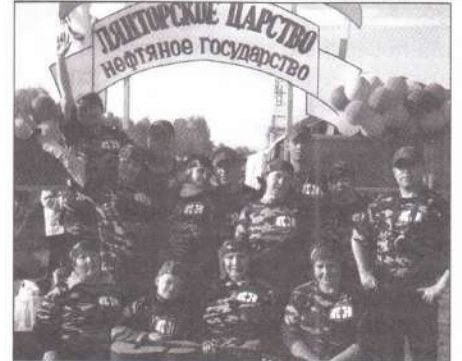
Команда «Лянторнефти» на фестивале авторской песни «Высокий мыс»

ППО осуществляет контроль за соблюдением прав и интересов работников в области охраны труда. Совместно с администрацией разрабатывает и утверждает инструкции по охране труда. Расследование и учет несчастных случаев на производстве проводится с участием представителей профсоюзной организации. Председатель ППО участвует в решении вопросов возмещения вреда, причиненного работникам увечьем, профессиональным заболеванием, либо иным повреж-