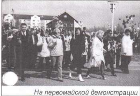
На Первомайской демонстрации

В цехах и подразделениях были созданы цехкомы. Стране нужна была нефть, и деятельность всех хозяйственных органов и идеологических институтов была подчинена этой цели.