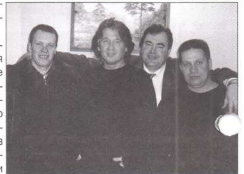
Вячеслав Малезжик в Лянторе по приглашению первичной профсоюзной организации НГДУ «Лянторнефть»

Профсоюзный комитет существует 30 лет. Не мало работников вышли на заслуженный отдых. ППО и здесь не остается в стороне. Ко Дню пожилого человека организуются праздничные мероприятия, пе-